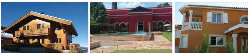
Illustration de constructions à proscrire, d'aspects non adaptés à la région ou néo classiques